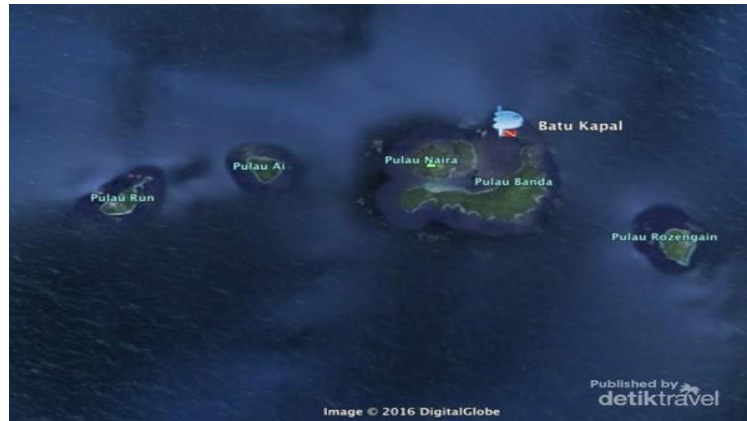
Gambar 3. Peta Lokasi Penelitian

Peta penelitian dapat dilihat pada gambar di bawah ini,