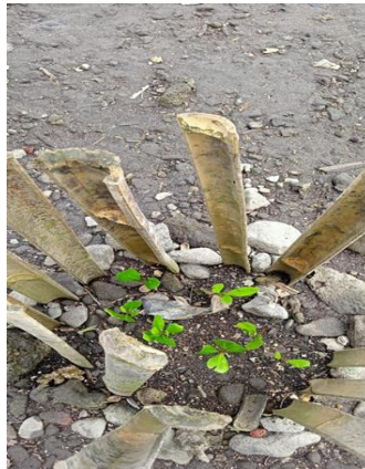
Gambar 4. Bibit mangrove yang ditanam dengan system kurungan bambu

Meskipun terdapat perbedaan nilai tingkat kelangsungan hidup namun dapat dikatakan bahwa kegiatan rehabilitasi mangrove dinilai berhasil karena rata-rata nilai yang diperoleh untuk ketiga stasiun di atas 70%. Keberhasilan hidup mangrove yang direhabilitasi dengan metode kurungan bambu pada setiap stasiun dapat dilihat pada gambar di bawah ini :