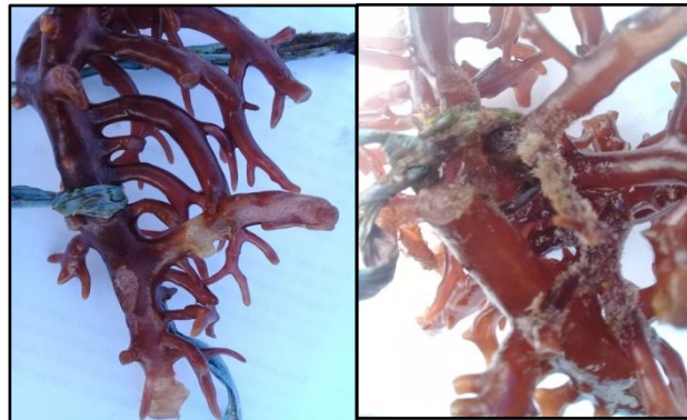
Gambar 3. Rumput Laut pada lokasi penelitian

Pada penelitian yang dilakukan keadaan rumput laut dapat dilihat pada gambar berikut ini: