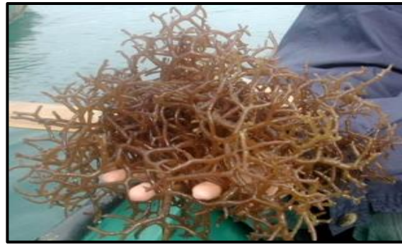
Gambar 1. Rumput Laut Kappaphycus alvarezii

Sehingga Perlu adaya informasi tentang identifikasi hama dan penyakit tersebut, maka perlu melakukan penelitian tentang Identifikasi Hama dan Penyakit pada Rumput Laut ( Kappaphycus alvarezii ) yang dibudidayakan di perairan pantai Kasten Negeri Nusantara Kecamatan Banda Kabupaten Maluku Tengah sehingga para pembudidaya dapat mengetahui penyakit-penyakit yang akan menyerang perkembangan rumput laut. Rumput laut Kappaphycus alvarezii dapat dilihat pada gambar dibawah ini :